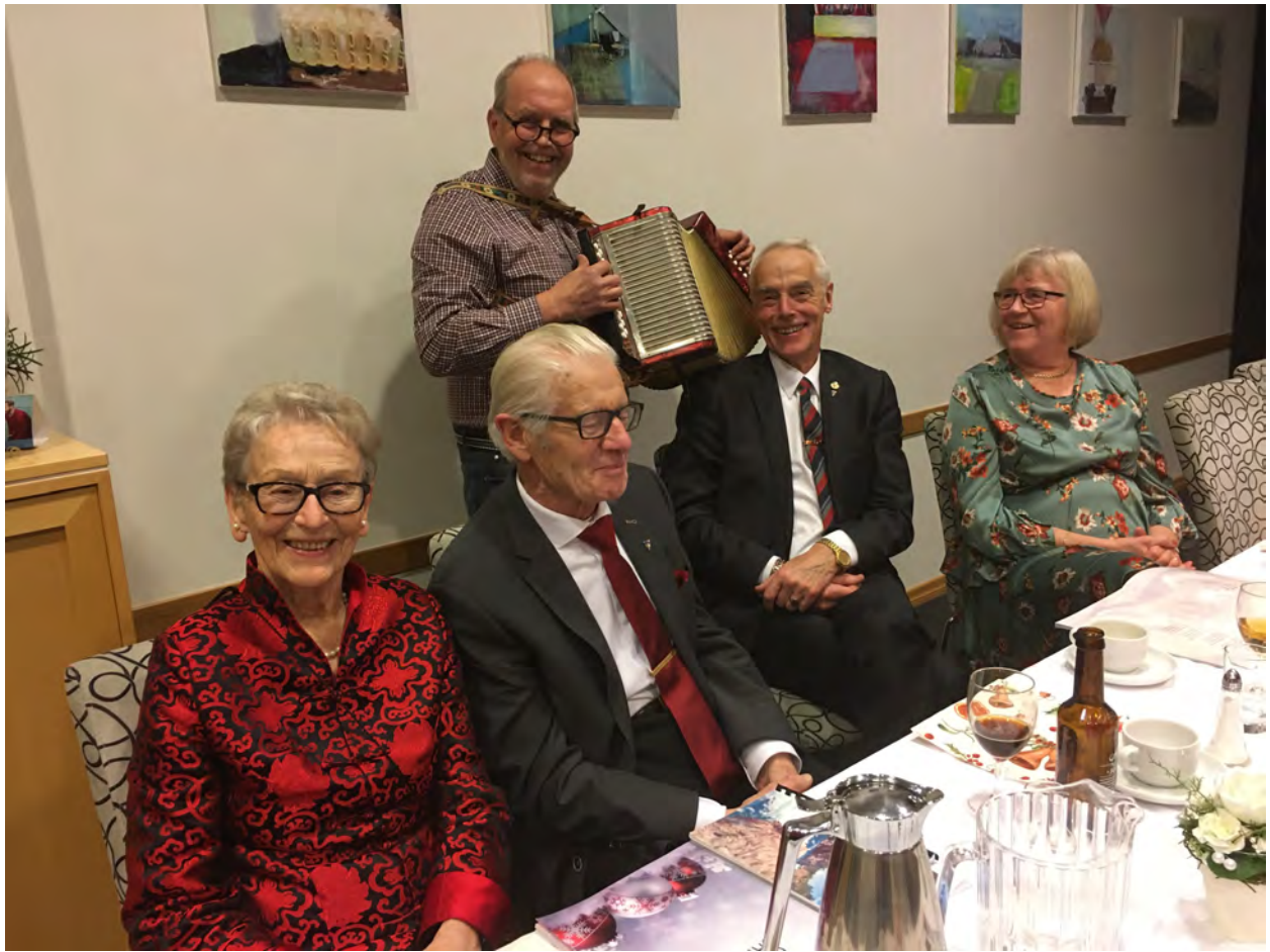
Moro med torader!