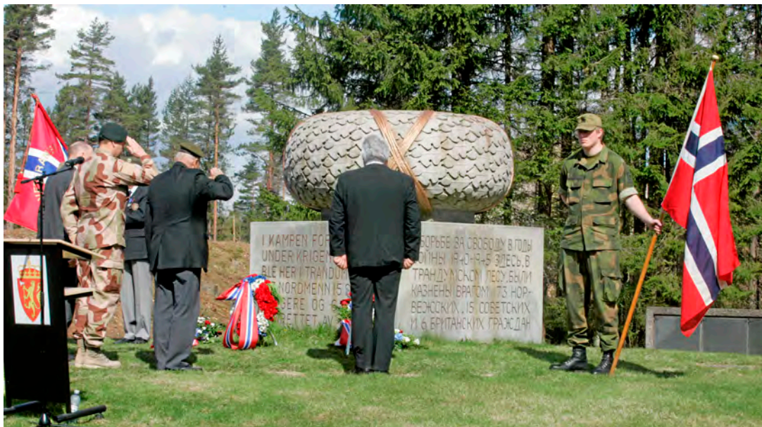
Snart mai måned med sine minner og høytideligheter...