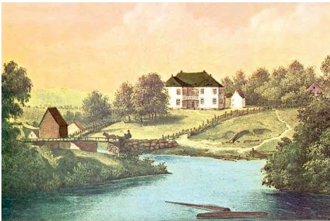
FRICH: "Parti af Eidsvold" Anno 1848

Bestill rom på nett eller tlf 63059100 snarest råd!