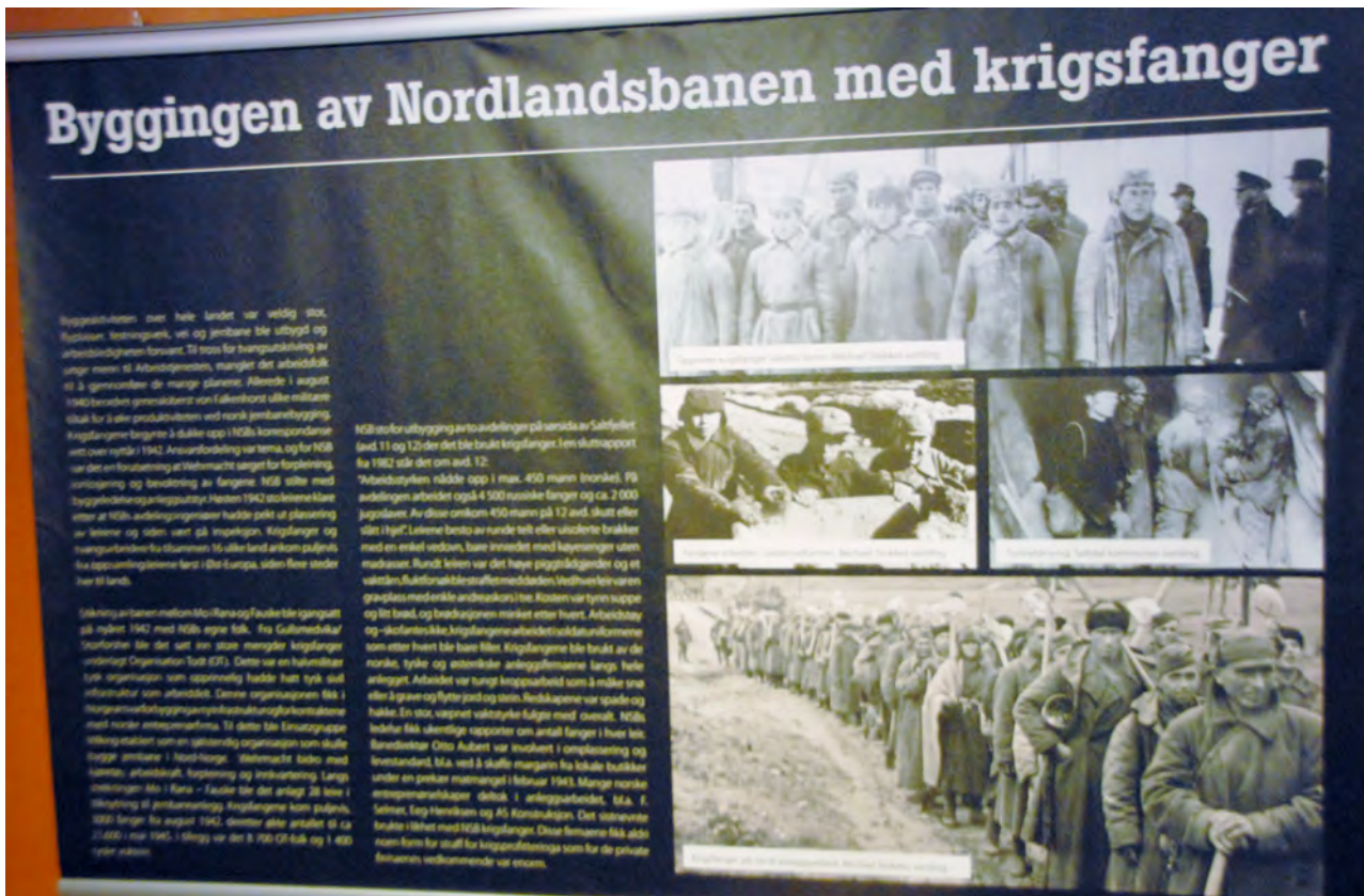
Denne plakaten sier sitt om hva som skjedde, hvor mye jernbanen i Norge kostet noen mennesker.