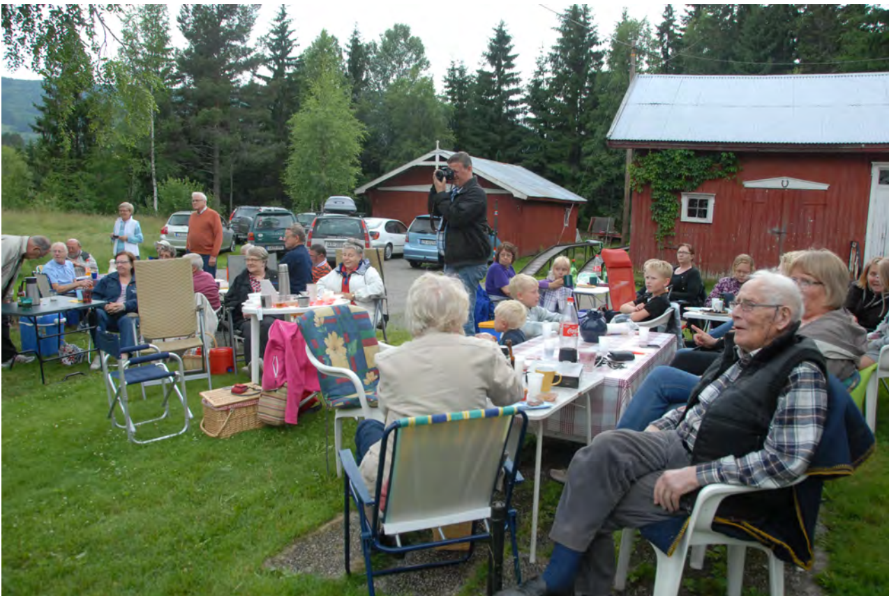
BILDET: Ta med familie og venner, husk å ha med noe til auksjonen til inntekt for Eidsvold Lodge!