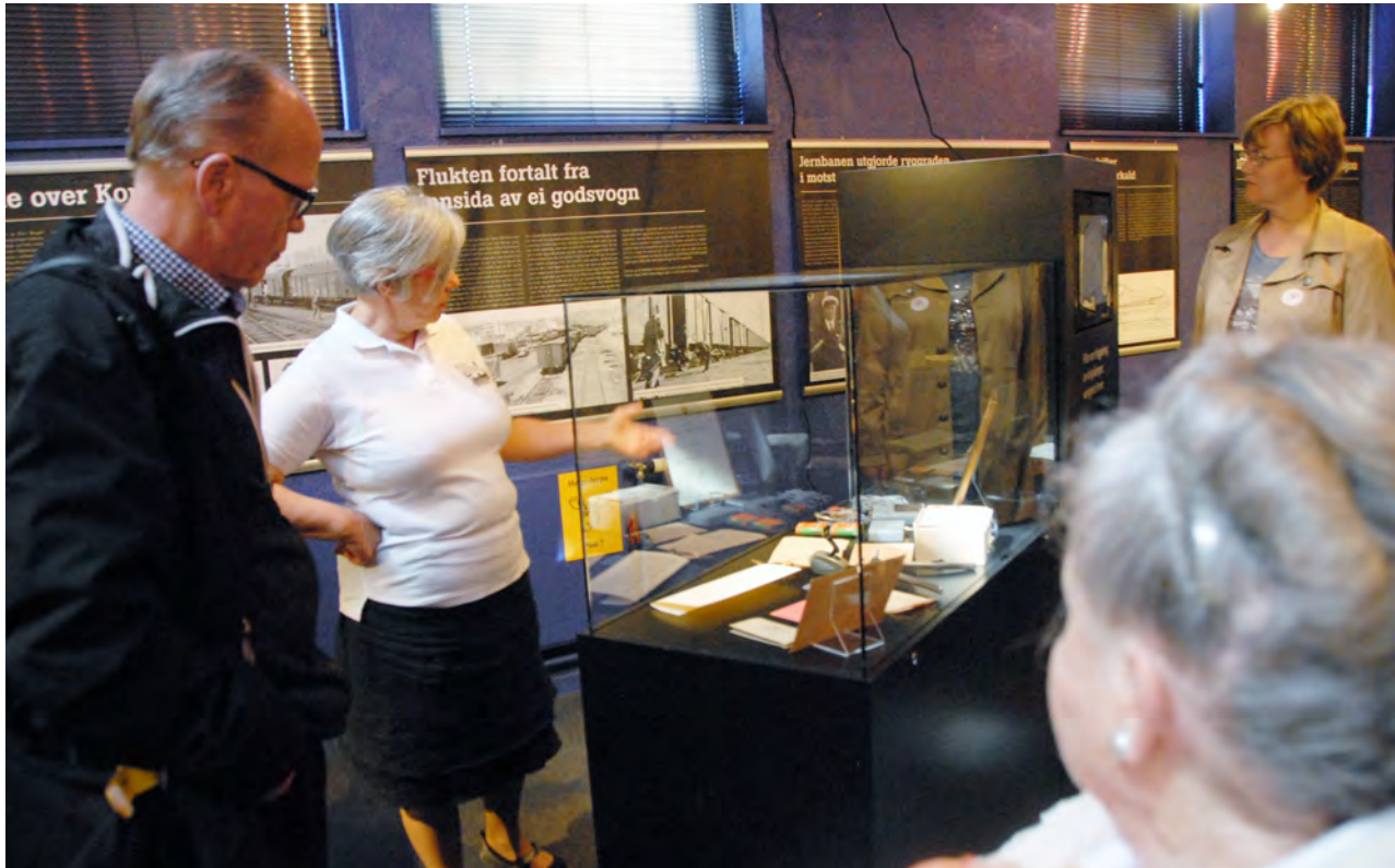
Omviseren var tydelig på at altfor mye av ting og dokumentasjon hadde forsvunnet i slutten av eller like etter krigen. Likevel en utstilling som gjør sterkt inntrykk på enhver besøkende.