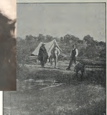
Scene fra guldgraverleiren