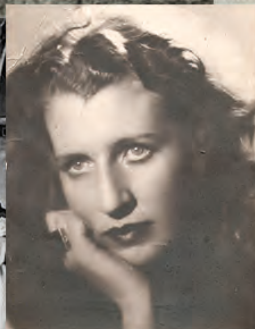
linaver. — Stranger har vel bare én ko