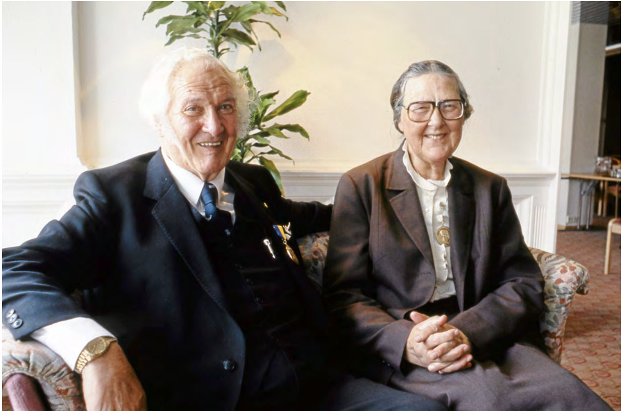
HJERTEVARME. En eneste gang møttes de – og fikk hverandre til å gråte over historiene de fortalte hverandre, Arne Arnardo og Annie Skau Berntsen.