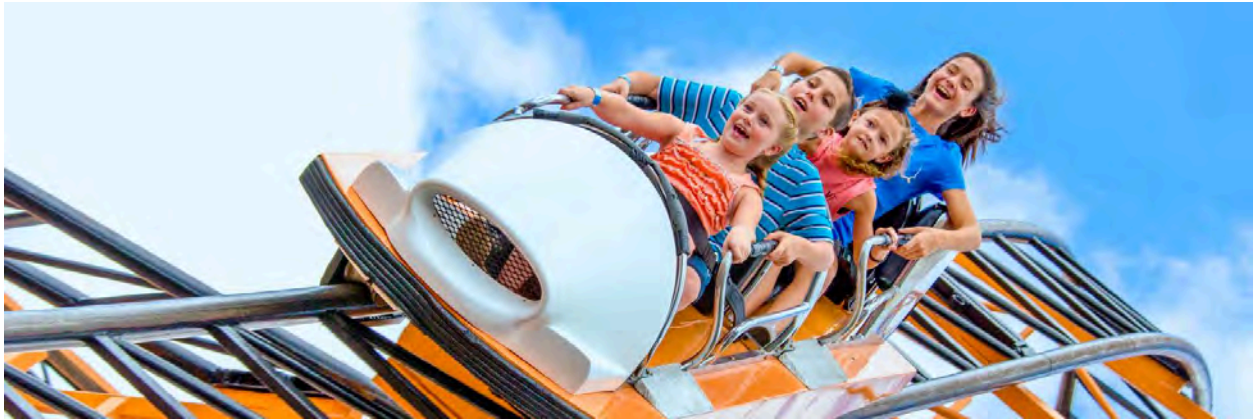
Bilde fra Indiana Beach reklame.