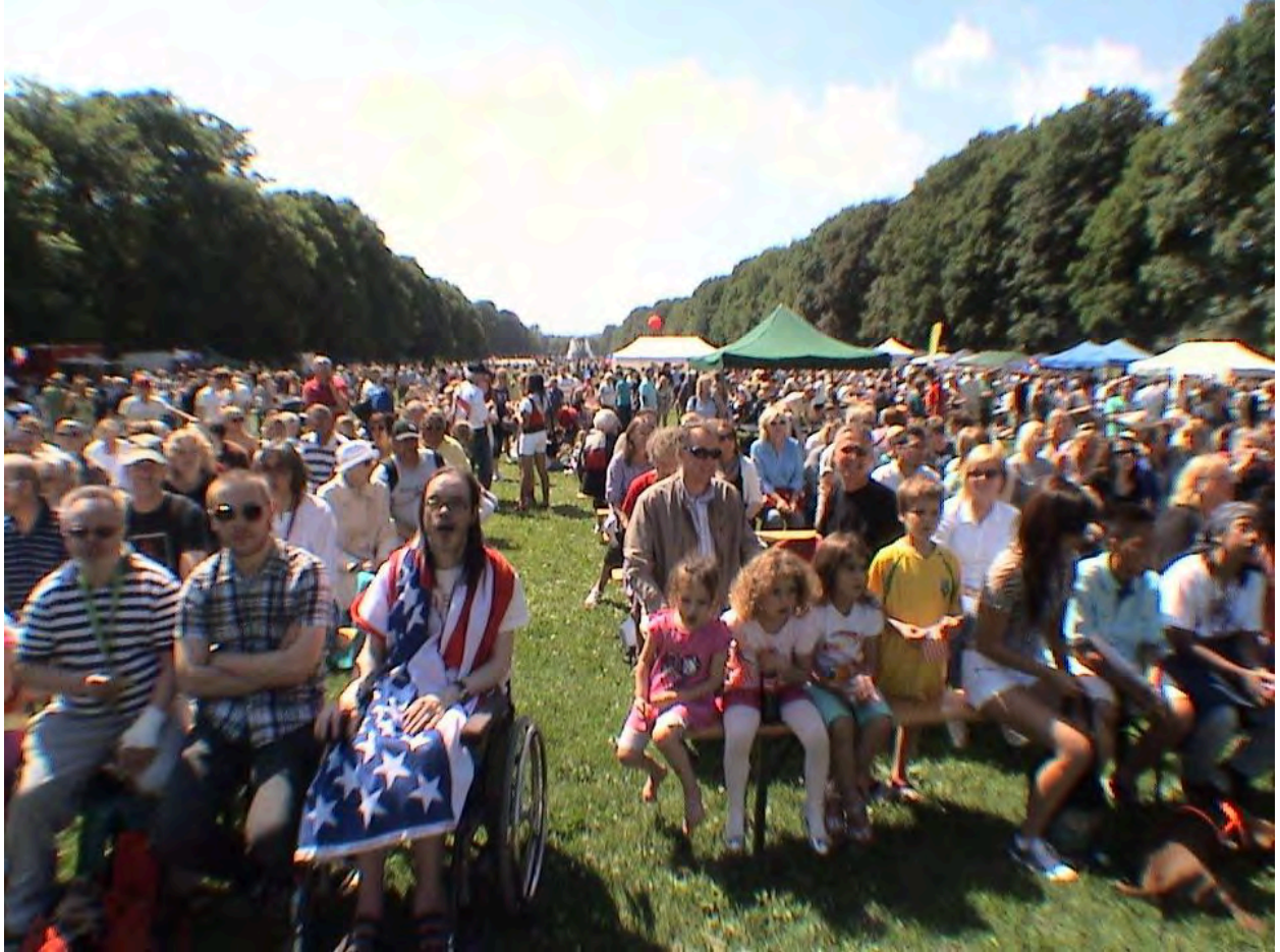
Bilde fra feiringen i Frognerparken i fjor.

ACCN is happy to announce this year's American Independence Day Celebration in Frogner Park, Oslo! Sunday, July 2nd, 2017 – Frognerparken 12:00 to 17:00