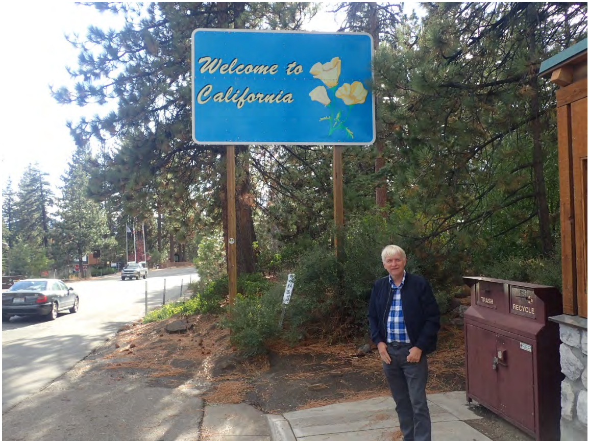
Stateline ved Lake Tahoe