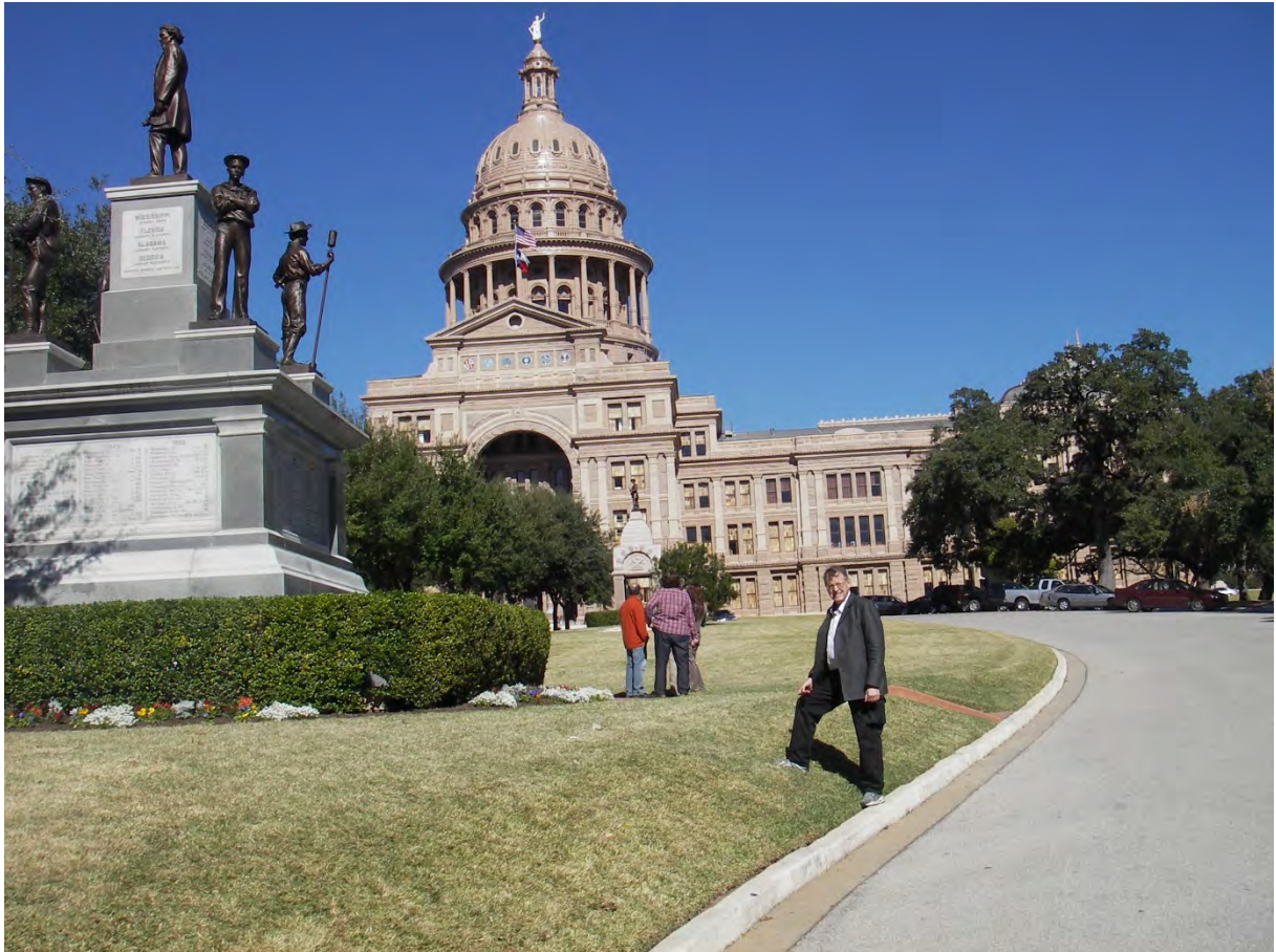
Texas Capitol i Austin