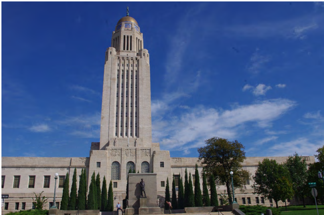
Nebraska Capitol i byen Lincoln. Reneste kommunistiske bunker. Styggeste vi har sett.