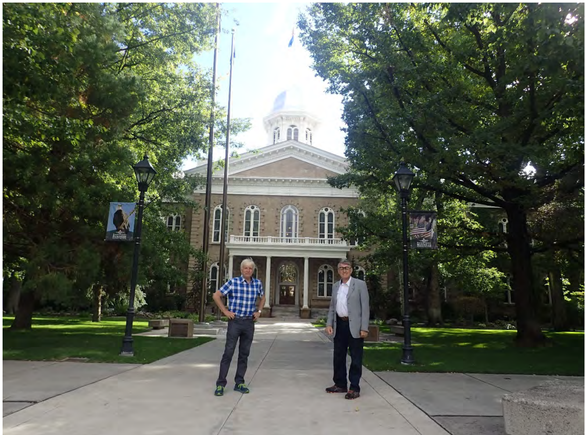
Nevada Capitol i Carson City