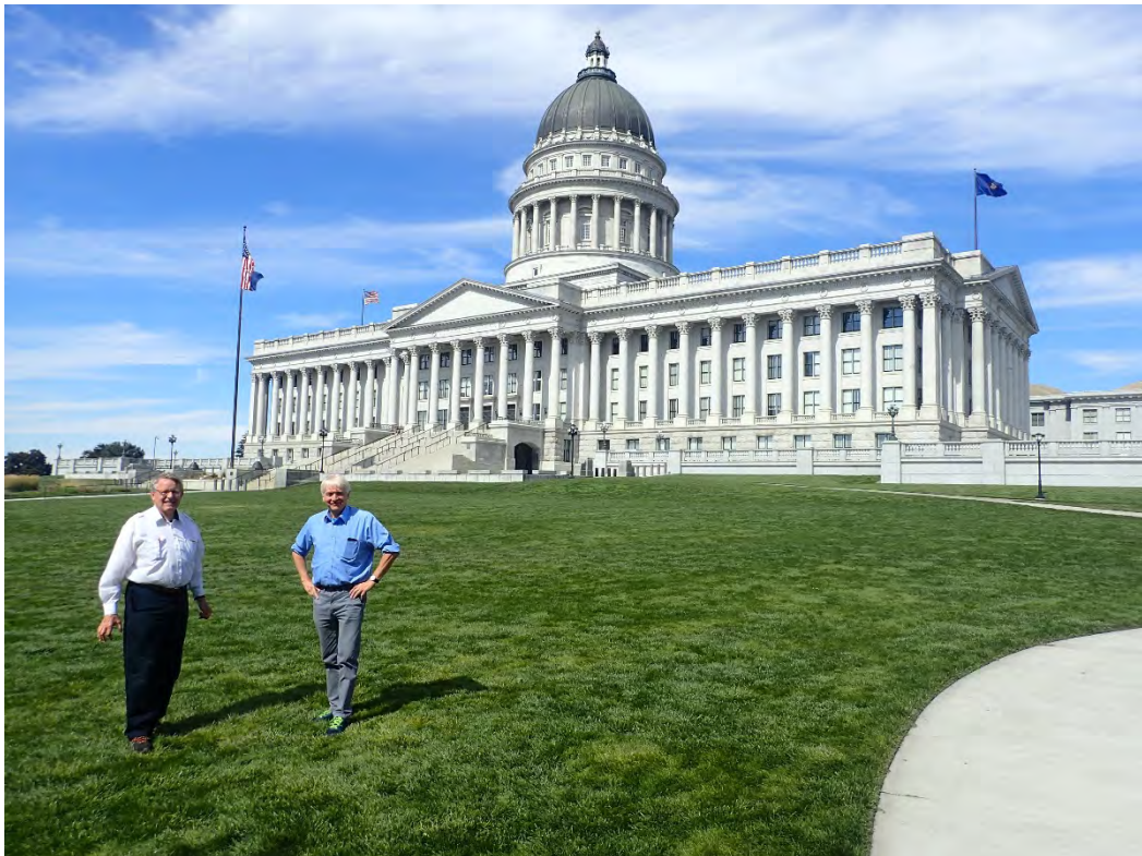
Utah Capitol i Salt Lake City – en av de flotteste delstat-capitol.