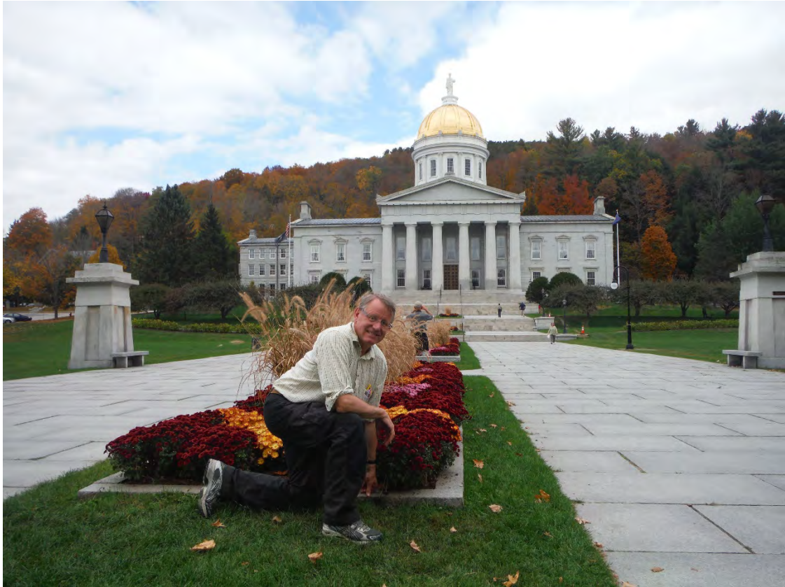
Vermont Capitol i Montpelier, den minste capitol i USA? (Eneste hovedstad i USA uten McDonalds!)