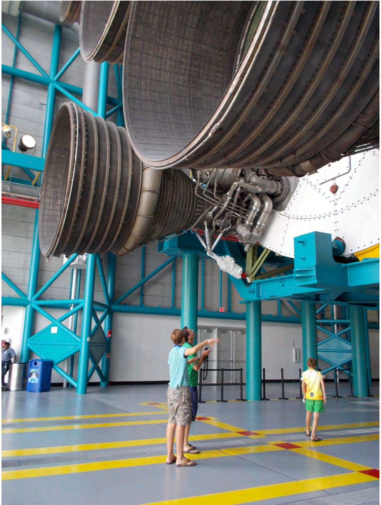
Folk fra hele verden beundrer ingeniør-vidunderne av de kjempestore rakettmotorene i Kennedy Space Center i Florida.