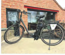
ELSYKLER PÅ Plass: Nå kan folk leie fire elsykler og åtte vanlige sykler fra Atlungstad Brenneri.